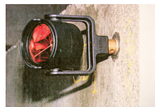
Réflecteur catadioptrique (CEREMA)