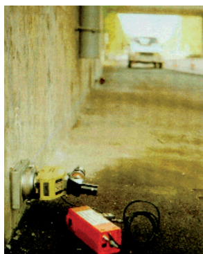
Distancemètre et récepteur en place sur un mur de culée (CEREMA)