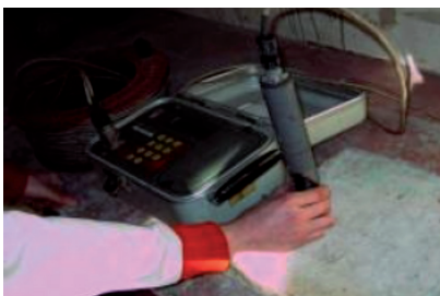
Appareil de mesure GECOR 06 (CEREMA)

Une électrode placée à la surface du béton est raccordée à une armature. L'appareil calcule la résistivité du béton à partir de la résistance (obtenue par la chute ohmique à partir d'une impulsion entre l'électrode et le ferrailage) et du diamètre de l'électrode.