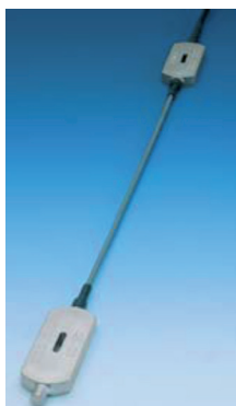
Corde optique de la société (OSMOS)

Le câble de raccordement entre le capteur et la station de monitoring peut avoir une longueur de 1 km.